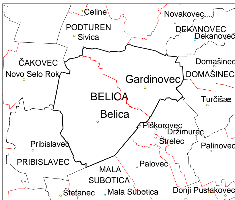
Kartogram 1 Odnos Općine Belica i okolnog prostora

Središte jedinice lokalne samouprave je Belica, a u Gardinovcu je ustanovljena i politička samoupravna jedinica – Mjesni odbor.