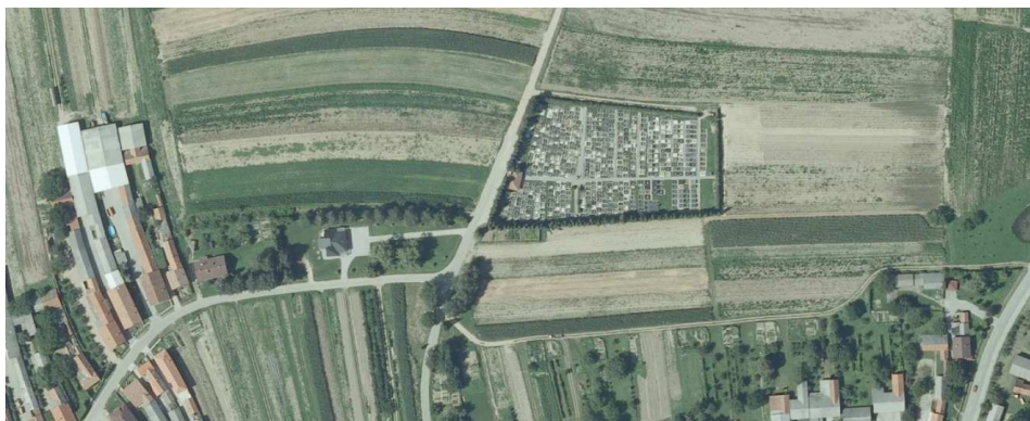
Prikaz 4 Groblje se planira širiti južno od postojećeg

Uvjeti uređenja i održavanja groblja zadržavaju se kao i kod dosadašnjeg PPUO. Mijenja se površina groblja i zona na koju je predviđeno širenje.