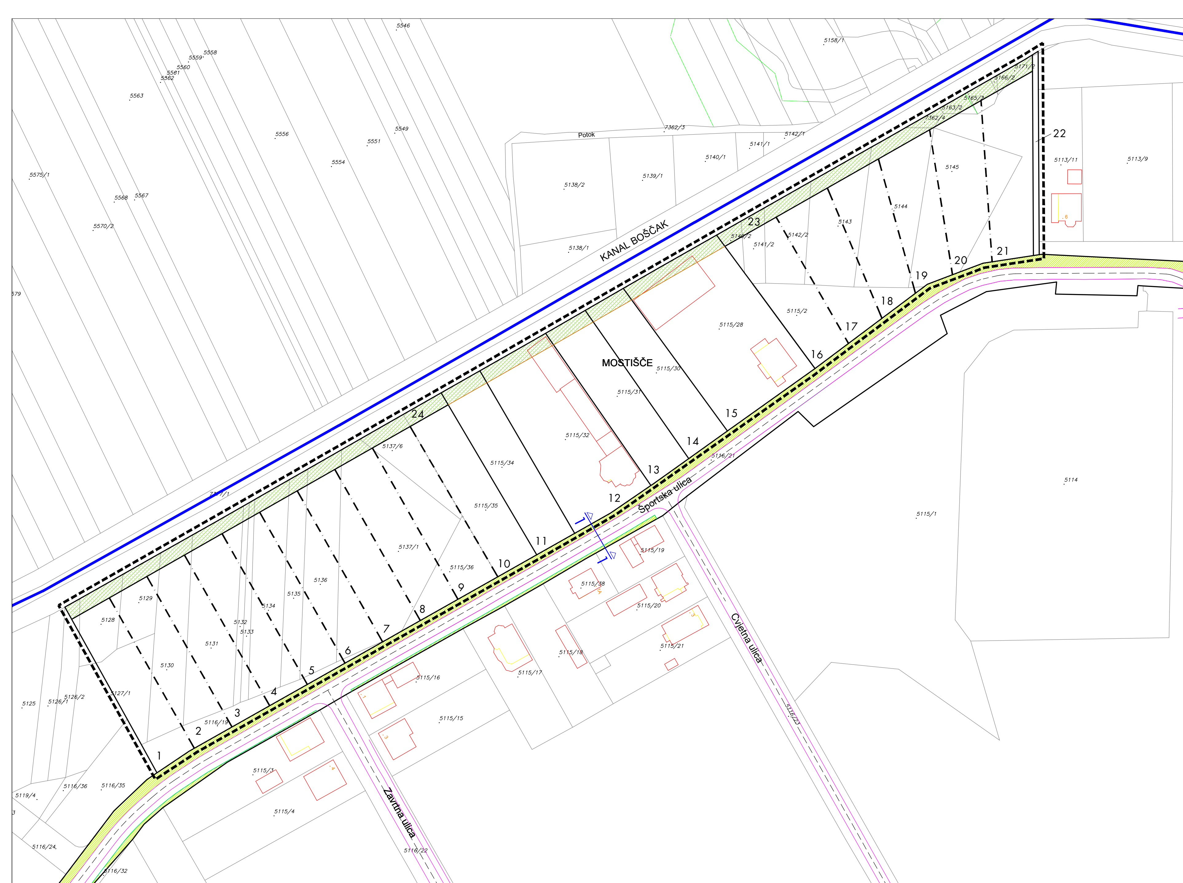
UK1 - presjek 1-1