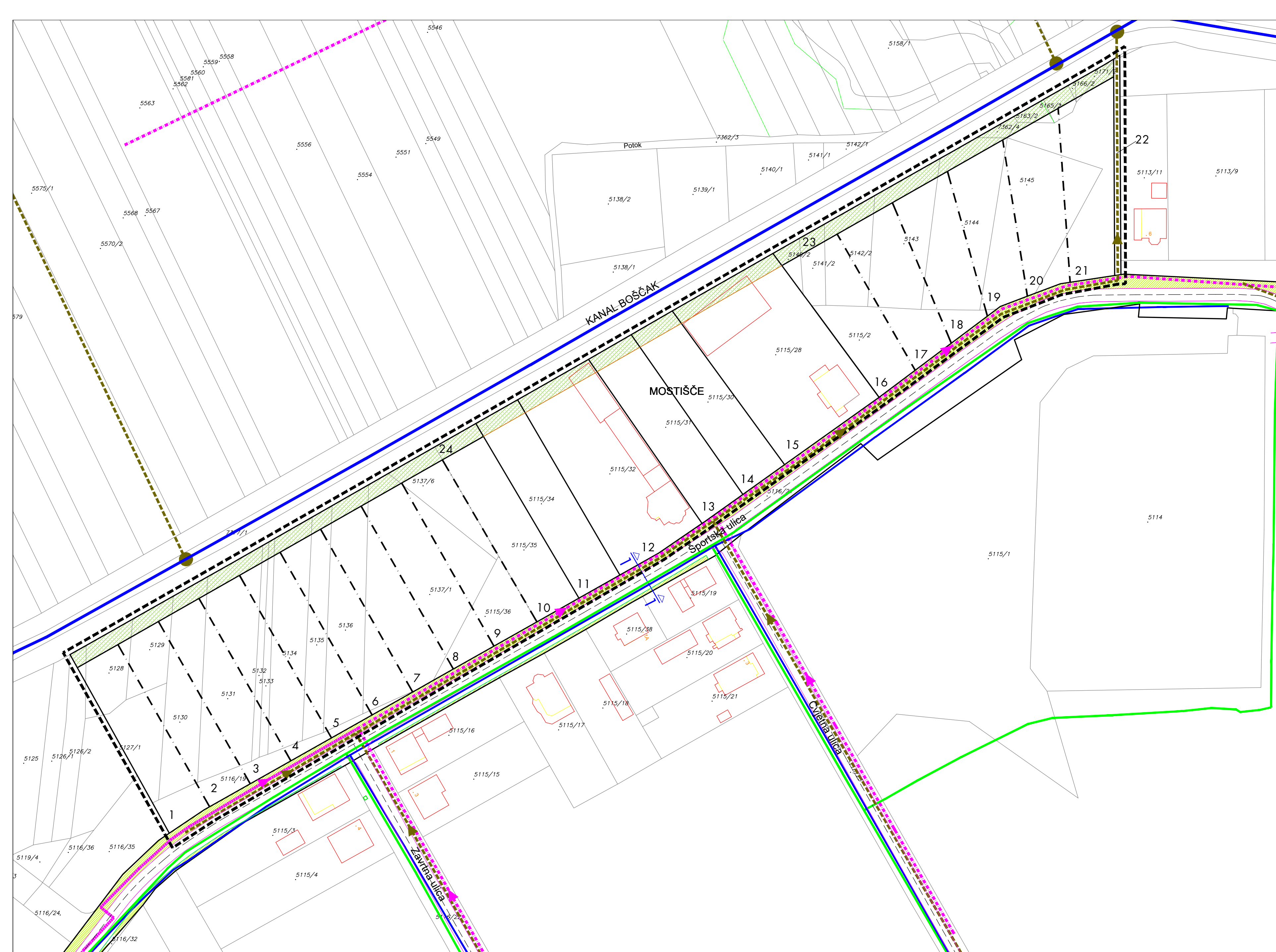
UK1 - presjek 1-1