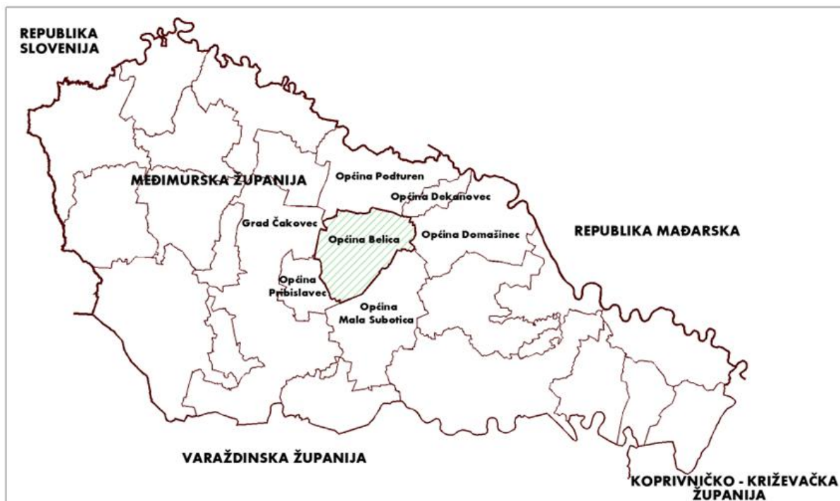
Prikaz 1 Prikaz Općine u odnosu na Županiju

Područje Općine Belica administrativno čine područja naselja Belica i Gardinovec.